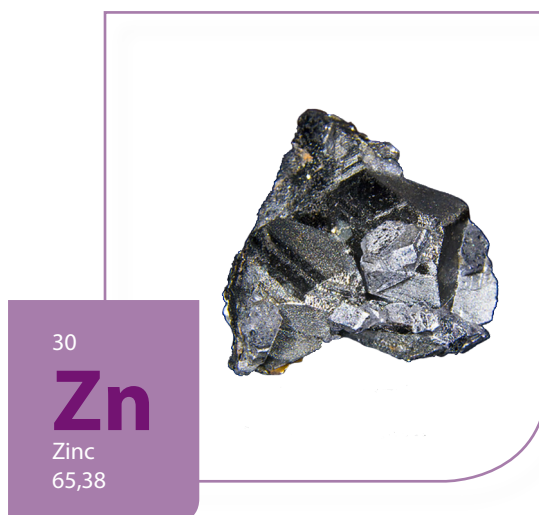
Photo: Sphalérite ou sulfure de zinc

N° CAS : 7440-66-6 N° EINECS : 231-175-3